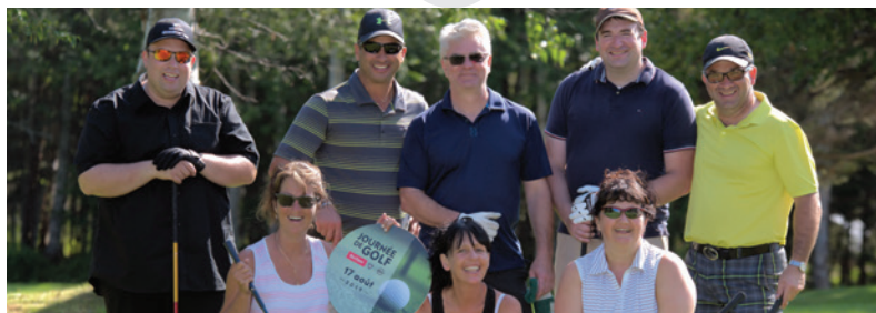
Deux des 22 quatuors ayant participé au tournoi de golf de Sept-Îles.

En soirée, les participants ont eu la chance de découvrir et de goûter la culture autochtone via les plats traditionnels servis par le traiteur du Centre Innushkueu Mani-Utenam.