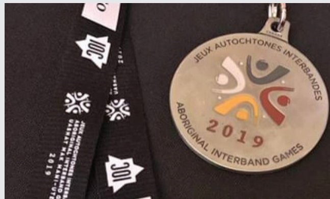
La médaille qui fut remise aux participants