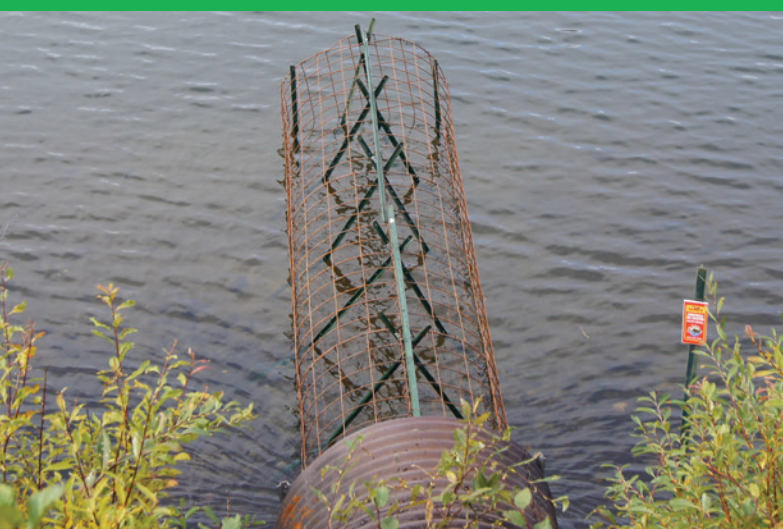
Vue rapprochée du système de contrôle

Le temps et les mœurs changent : nous avons le devoir de repenser et adapter nos façons de travailler afin d'améliorer non seulement la sécurité et les coûts de l'entreprise, mais aussi l'environnement. Voilà donc une autre belle initiative qui s'inscrit dans une démarche de développement durable et qui contribue à la mise en application de nos valeurs organisationnelles.